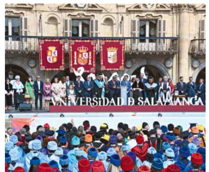
r.1. Istodobno je proslavljena i 800. godišnjica Sveučilišta u Salamanci