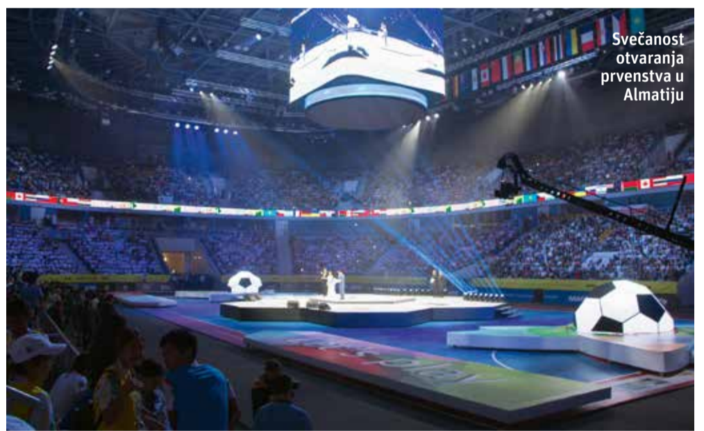
Svečanost otvaranja prvenstva u Almatiju