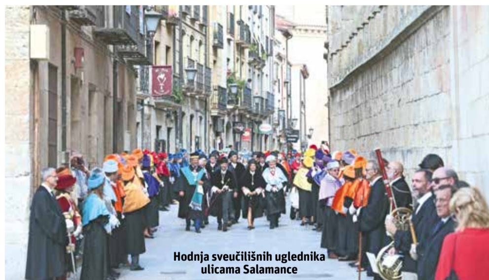
Hodnja sveučilišnih uglednika ulicama Salamance

U Salamanci je, u nazočnosti predstavnika 185 sveučilišta i španjolskog kraljevskog para, obilježena 30. godišnjica Magna Charta Universitatum i 800. obljetnica sveučilišta u tom španjolskom gradu, a tom prigodom je i Sveučilište u Splitu pristupilo tom važnom dokumentu usvojenom 1988. u Bologni