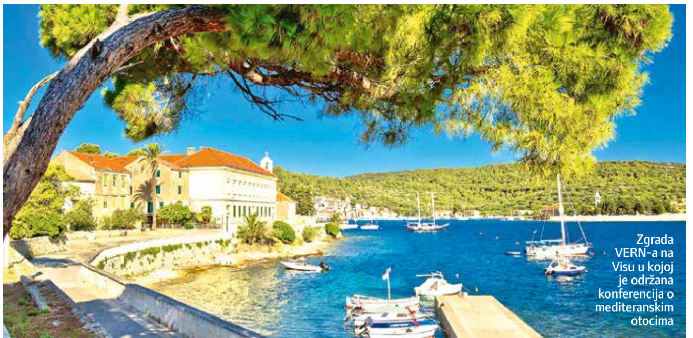
Zgrada VERN-a na Visu u kojoj je održana konferencija o mediteranskim otocima

O rezultatima natječaja kandidati/kandidatkinje će biti obaviješteni u roku od 15 dana od dana donošenja odluke o izboru.