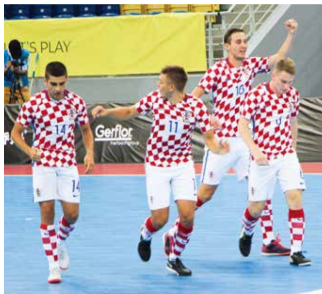
Slavlje u znaku 'kockica'

Unatoč tome što su naši momci za suparnike često imali A reprezentativce velikih futsal nacija, više ili manje uspješno su im parirali, pa su svoj nastup zaključili s tri pobjede i tri poraza. Bili