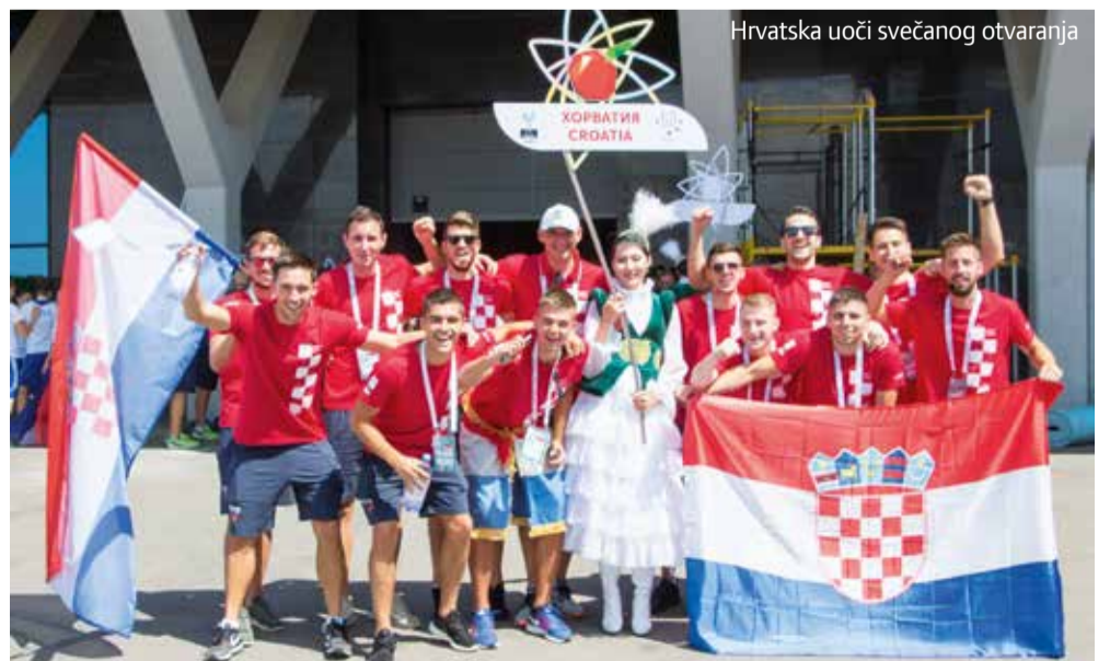
Hrvatska uoči svečanog otvaranja