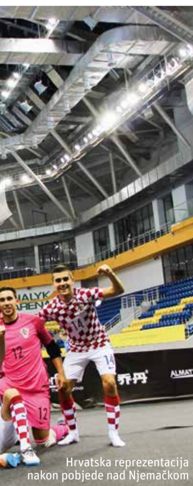
Hrvatska reprezentacija nakon pobjede nad Njemačkom