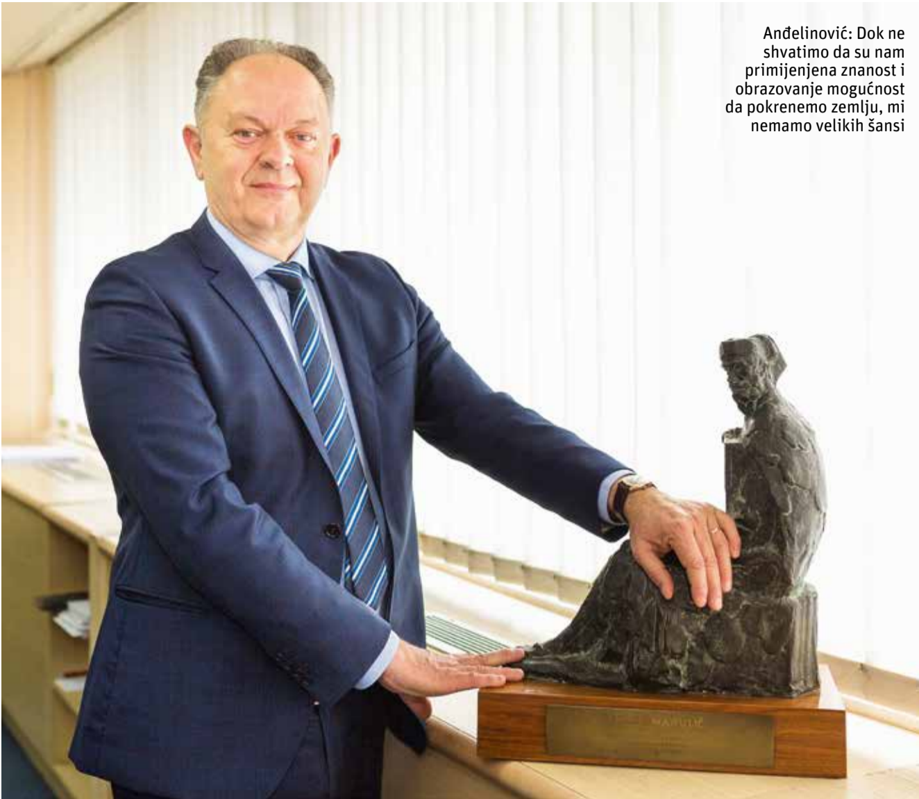
Andelinović: Dok ne shvatimo da su nam primijenjena znanost i obrazovanje mogućnost da pokrenemo zemlju, mi nemamo velikih šansi