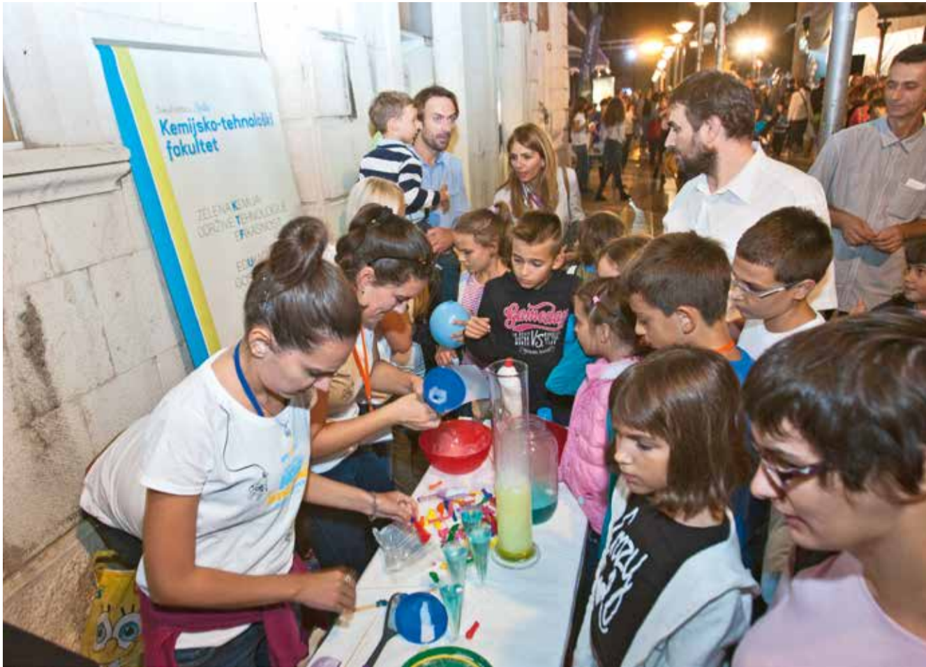
S jednog od ranijih izdanja Noći istraživača