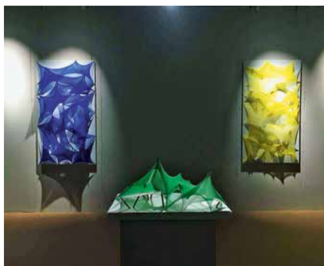
Neki od rezultata kolegija "Biomimetika: Priroda nas poučava" na Kineskoj akademiji umjetnosti

sušan je izvor istraživanja, propitivanja i eksperimentiranja. Tijekom realizacije početnih ideja neka rješenja se razrađuju, dok se ostala odbacuju. Pri procesu razvijanja ideja studenti imaju velik broj mogućnosti, te se u skladu s tim stalno prilagođavaju novonastalim saznanjima. Od velike je važnosti studentima omogućiti obrazovanje koje će ih osposobiti za ozbiljno uključivanje oko kritičnih pitanja i preuzimanje akcija, te razraditi okvir za istraživanje znanosti i njeno uključivanje u pitanje okoliša. Istovremeno razumijevanjem i povezivanjem različitih i složenih dimenzija može se bolje razumijeti stvaralački proces i doći do novih spoznaja, a time postajemo dio veće društvene mreže.