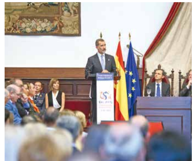
Španjolski kralj Felipe VI. obraća se uzvanicima u Salamanci

dobrobit studenata, društva i akademskih zajednica. Ili, kako je rekao rektor Sveučilišta u Salamanci Ricardo Rivero: - Visokoobrazovne institucije moraju surađivati preko granica, a privlačenje nastavnika i studenata iz cijeloga svijeta mora biti jedan od pokazatelja kvalitete, jer su mobilnost i akademska diplomacije ključevi međusobnog razumijevanja ljudi i mira.