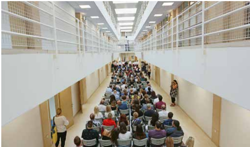
Nove prostorije Filozofskog fakulteta Sveučilišta u Splitu u bivšoj upravnoj zgradi Brodomerkura