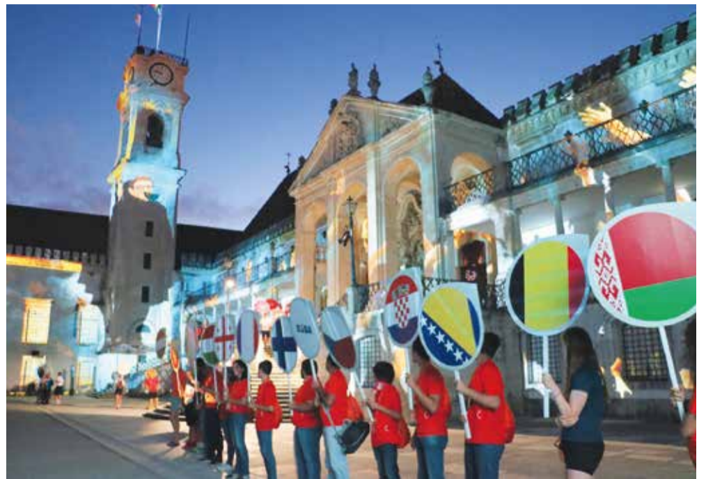
Vrhunac prethodne sezone bile su Europske sveučilišne igre u portugalskoj Coimbri

– Svi mi uključeni jedva čekamo novu sezonu jer po svemu vidimo kako je pred nama jedna velika godina. Na europskoj nas razini opet dočekuje puno prvenstava, a ekipa Sveučilišta u Splitu, osvajač titule prvaka Europe u velikom nogometu, sudjelovat će na svjetskoj ligi u Kini, gdje će odmjeriti snage sa sveučilištima svih kontinenata. Iduće ljetno pred nama je i najveća svjetska studentska sportska manifestacija – ljetna Univerzijada u Napulju – gdje planiramo nastupiti s velikom delegacijom te nakon dugo vre-